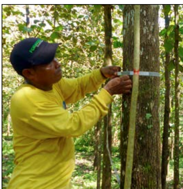
Varje år mäts trädens diameter så vi får en exakt bild av tillväxten.