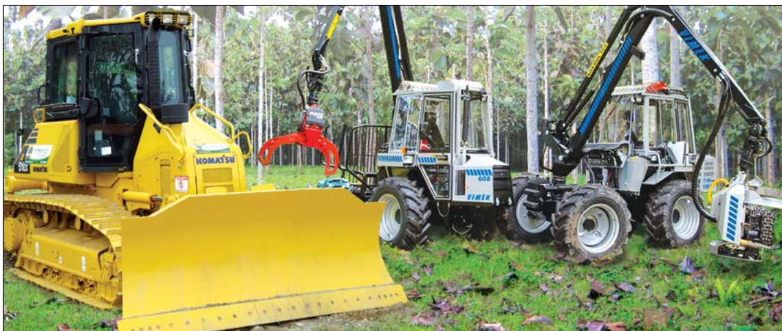
Green Growth Nordic ABs maskiner