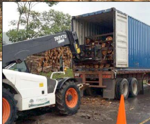
Containerlastning med frontlastare.