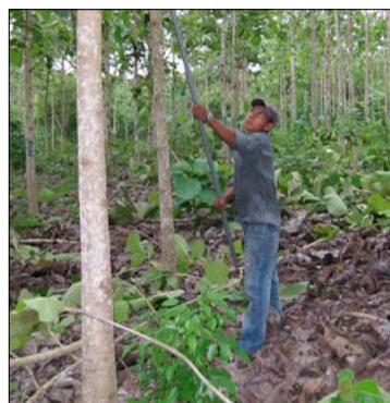
Löpande genom åren sker stamkvistning.