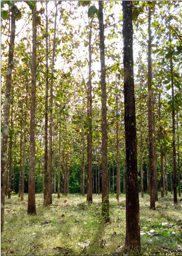
En av våra planteringar med 11 årig teak.