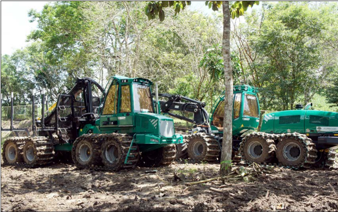
Ett par av våra skogsmaskiner.